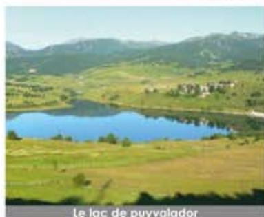
Le lac de puyvalador