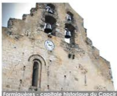
Formiguères - capitale historique du Capcir